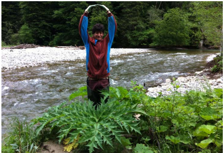
Foto: Riesenbärenklaus, zu erwartender Blütenstand vom Zivi nur angedeutet, mit ca. 2'- 3'000 potenziellen Samen!

Insgesamt kann wiederholt bestätigt werden, dass die gesteckten Ziele der Neophyten-Bekämpfungsaktion zum grössten Teil erreicht wurden, v.a. bezüglich des Riesenbärenklaus und des japanischen Staudenknöterichs sowie des Sommerfleders.