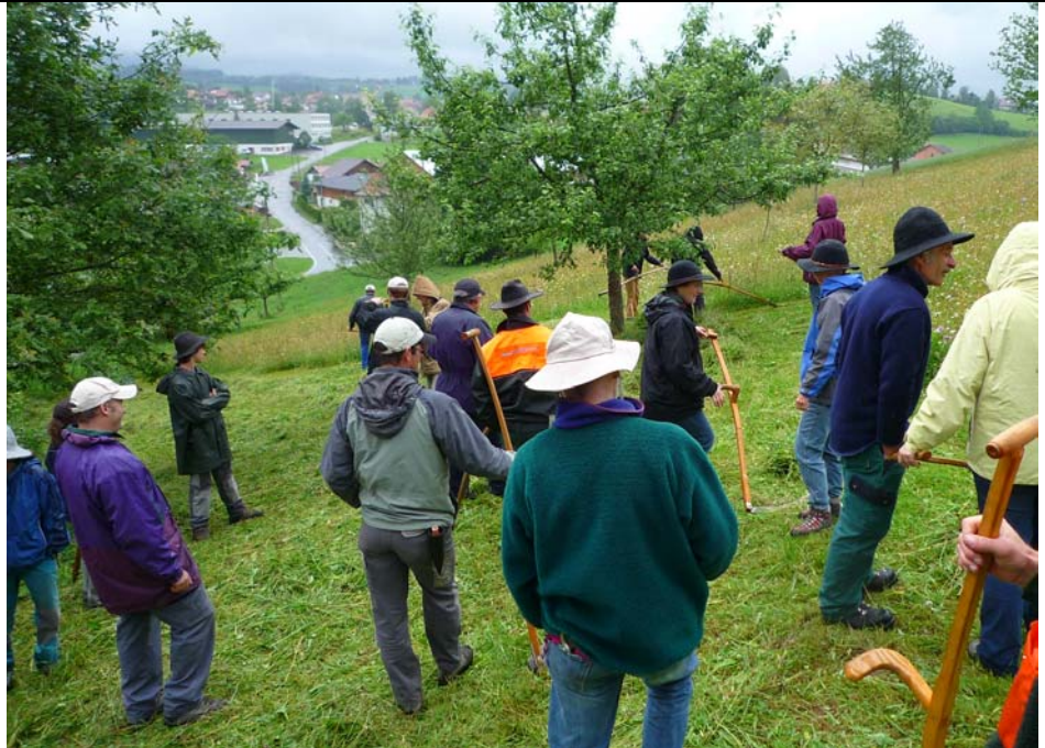
Foto: TeilnehmerInnen freuen sich auf den praktischen Test-Einsatz mit der Sense